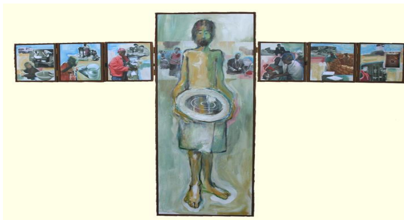
De zeven werken van Barmhartigheid

Het leven is ons door God gegeven. Dankzij Hem bestaan we. Hebben we eten en drinken. Leven we in vrijheid. Jezus spoort ons aan om bezig te blijven met barmhartigheid. Laten we ons hart openen en de gebrokenheid binnen laten. Zodat we vol ontferming bewogen zijn. Vanuit ontferming gaf God Zijn Zoon. Voor ons. Als onze Redder. Jezus roept ons op in Lucas 6:36: "Wees barmhartig, zoals jullie Vader barmhartig is". Amen!