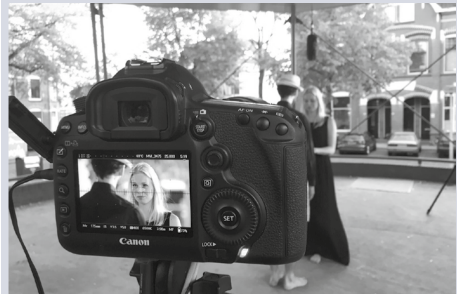
De opname van het filmpje over Hooglied.

Voor kerken die nog geen aanbod voor 18-plussers hebben, is dit materiaal een stimulans om samen met jongeren een kring op te zetten! Meer info en tips: www.ontdekkendbijbel-lezen.nl .